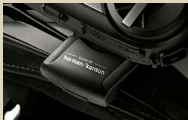
セナ製品の最高峰「クァンタム」シリーズのサウンドは、高級オーディオ「ハーマン&カードン」の手によるもの。そんなサウンドをセナプロショップで体験できる。今後体験コーナー実施店舗は随時拡大していくぞ!

SENAメッシュ & ハーманカードン音質体験コーナー SENAプロショップにて順次開催!