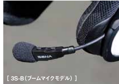
[ 3S-B(ブームマイクモデル) ]