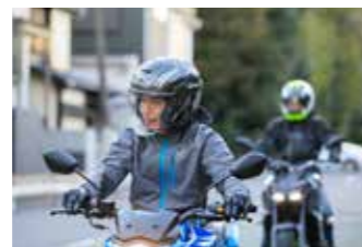
メッシュインターコムならたとえ仲間とはぐれても、再び通信圏内に入れば自動的に接続してくれる。公開モードであればとてもクリアな音質で会話ができる

従来のグループモードの拡大版、もちろん「メッシュ」接続なので、誰が誰とつながって、なんてことを考える必要はない。さらに30Kではこのメッシュインターコムに、従来のBluetoothインターコムを参加させることも可能。つまり30Kは「セナメッシュインターコム」と従来のBluetoothインターコムを同時に使える、革新的な「ハイブリッドインターコム」なのだ。