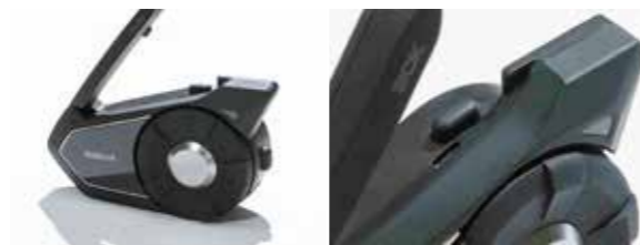
他機種と同様のボタン周り

大きなジョグダイヤルと本体後面のフォンボタンという、セナ・インターコム共通のアイデンティティは30Kでもしっかり継承