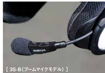
[ 3S-B(ブームマイクモデル) ]

操作ボタンはわずか2つ（プラスボタン、マイナスボタン）だ。ブーム型マイクモデルはマイクの付け根に、ケーブル型マイクモデルは、帽体に貼り付けたパッドにボタンがあり長押しで設定できる