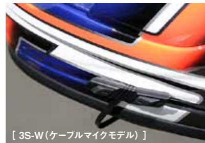
[ 3S-W(ケーブルマイクモデル) ]