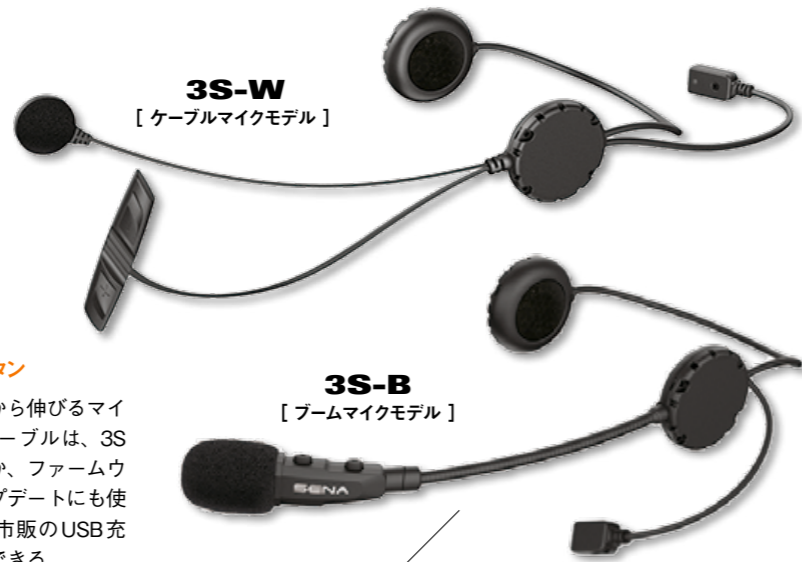
3S-W [ ケーブルマイクモデル ]