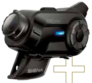
10C PRO 価格：4万9280円

セナのインターコムのラインナップには、動画を収録できるインターコム「10C PRO」もある。最大でフルHDサイズの動画が撮影できるカメラと、10シリーズ相当のインターコムが合体。さらに「スマート・オーディオ・ミックス」機能を使えば、動画にインターコム通話やスマホの音楽、FMラジオの音声を重ねて収録可能。+メッシュを使ってメッシュネットワークに接続すれば、メッシュ通話に参加するメンバーすべての音声を動画に収録することができる。