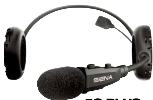
3S PLUS 価格：1万2760円