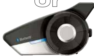
20S EVO 価格：3万4540円