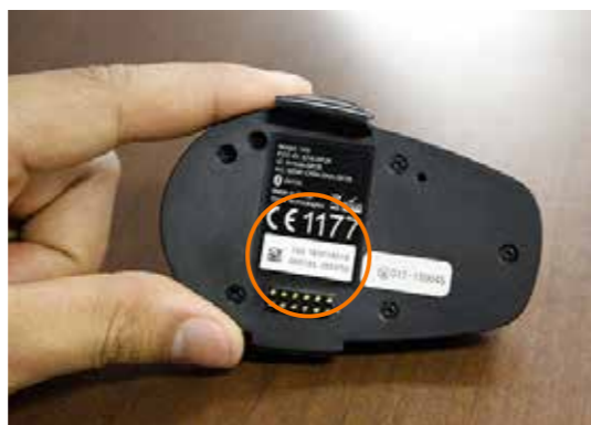
本体裏のシリアル番号で登録

製品を登録で、使い方の情報調べが簡単になる。登録はシリアル番号とBluetooth IDが必要で、これらは本体のラベル上に、またパッケージ箱に記載